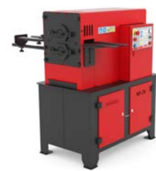
MACHINES À FORGER À CHAUD