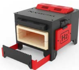
FOURS DE FORGE