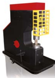
MARTEAUX PILON POUR LA FORGE