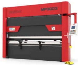
PRESSES PLIEUSES HYDRAULIQUES