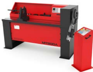
CINTREUSES À VOLUTES