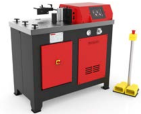
PRESSES PLIEUSES HORIZONTALES