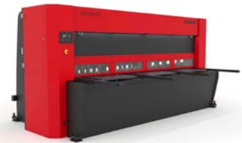
CISAILLES GUILLOTINES HYDRAULIQUES