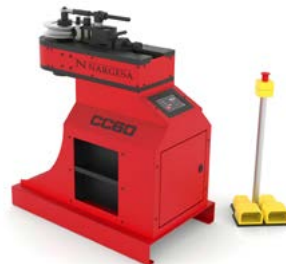
CINTREUSE À TUBES SANS SOURIS