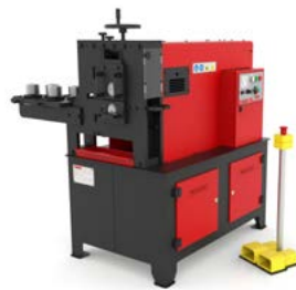
MACHINES À GAUFRE À FROID