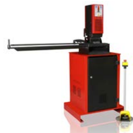
PRESSES DE SERRURES