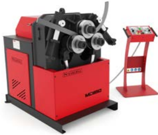
CINTREUSES À GALETS